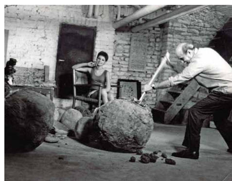
Lucio Fontana, Concetto spaziale, Natura (Concept d'espace, Nature), 1959-1960. Six exemplaires en bronze.