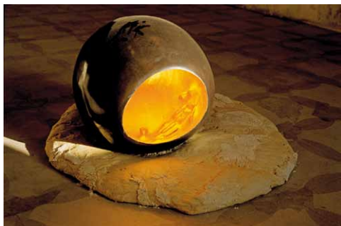
Io (l'uovo) (Moi [l'œuf]), 1978. Bronze. Installation sur de la pâte à pain lors de l'exposition Fabroniopera, Luciano Fabro, Palazzo Fabroni, Pistoia, 1994.

dans les années 1980, par exemple, ou encore la globalisation et le refus des cultures spécifiques de l'art dans les années 1990, ou plus récemment l'abandon de la notion d'œuvre) cachait diverses formes d'homologation. Pour Fabro, il s'agissait d'un abandon de ce qui devait rester le domaine spécifique de l'art : ce lieu où la liberté est un dilettantisme engagé et l'œuvre le résultat d'une position d'auteur.